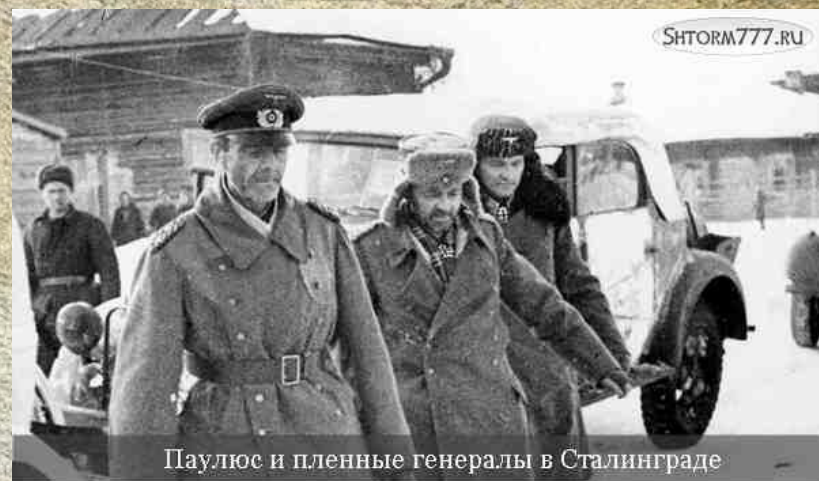
Паулюс и пленные генералы в Сталинграде

31 января была ликвидирована южная группировка фашистов, пленен фельдмаршал Паулюс с 24 генералами. 2 февраля капитулировала северная группировка немцев