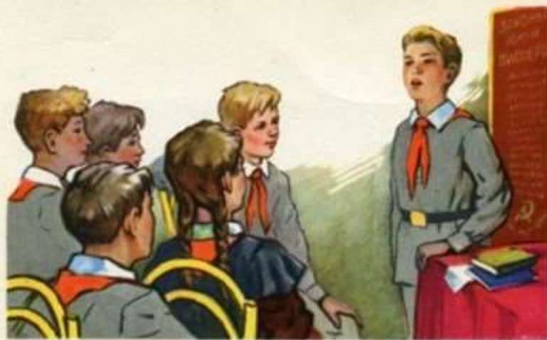
ПИОНЕР ГОВОРИТ ПРАВДУ, ОН ДОРОЖИТ ЧЕСТЬЮ СВОЕГО ОТРЯДА