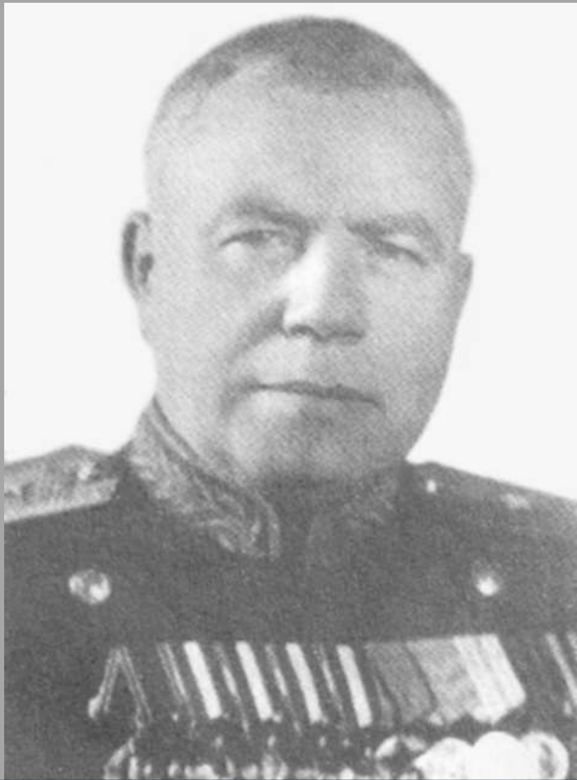
генерал-майор С. П. Микульский

Наиболее успешно развивалось наступление на участке 131-го стрелкового корпуса. В первый же день корпус прорвал главную полосу обороны противника и вышел к реке Титовка. Советские войска форсировали реку и захватили плацдарм. Затем корпус вёл бои по расширению плацдарма и начал наступление на Петсамо с юго-востока.