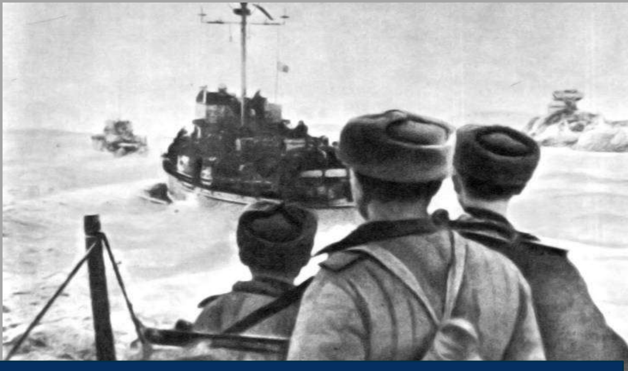
Корабли Северного флота с десантниками на пути к Киркинессу