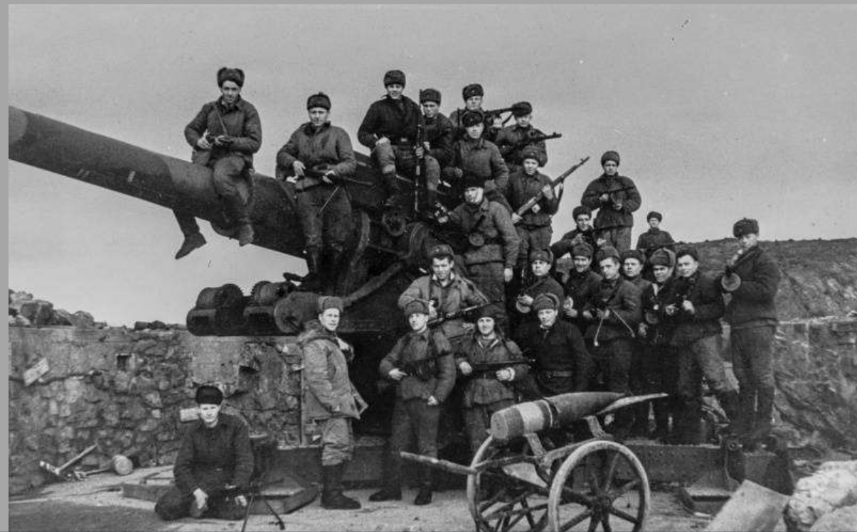
Бойцы 12-й бригады морской пехоты Северного флота

Успешно наступали и другие соединения фронта. На левом фланге 126-й легкий горнострелковый корпус успешно совершил глубокий обход по труднодоступным местам позиций и вышел в район западнее Луостари. Здесь немцы имели только очаговую оборону, полагаясь на неприступность болотисто-речной местности, лишённой не только дорог, но и троп. Советским солдатам приходилось форсировать ледяные водные преграды и карабкаться по скользким гранитным скалам.