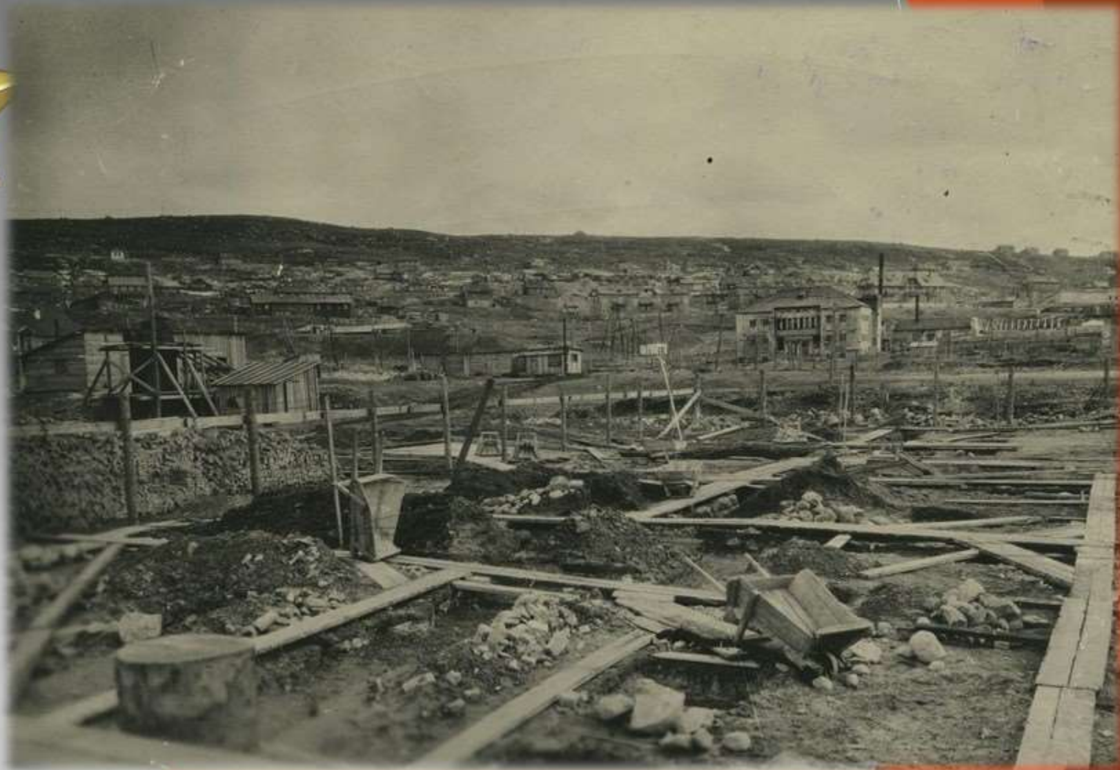
Панорама Мурманска. пр. Ленина, каменное здание-баня№2