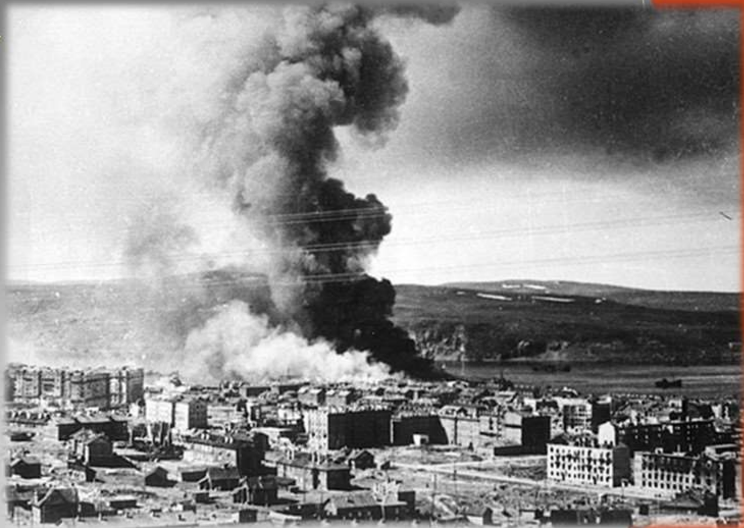
Удар вражеской авиации