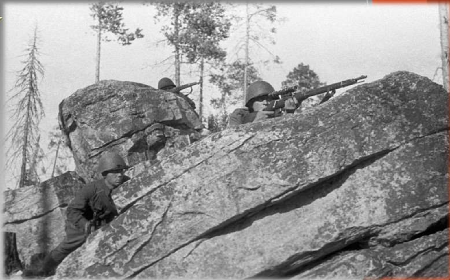
Снайперы в засаде в районе Мурманска