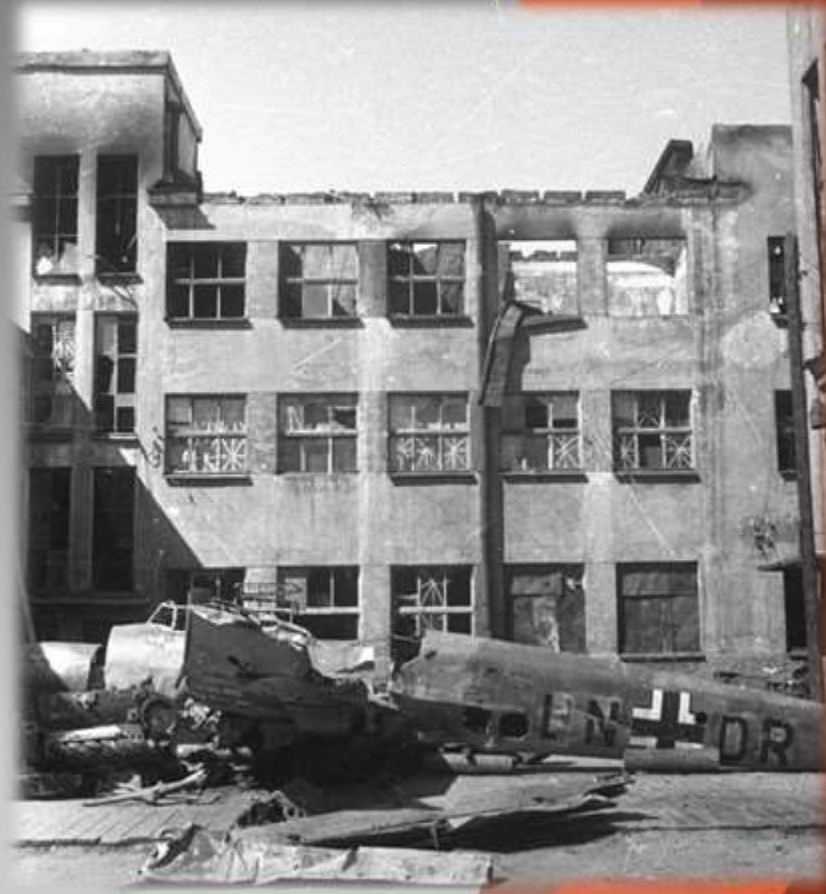
Сбитый немецкий истребитель