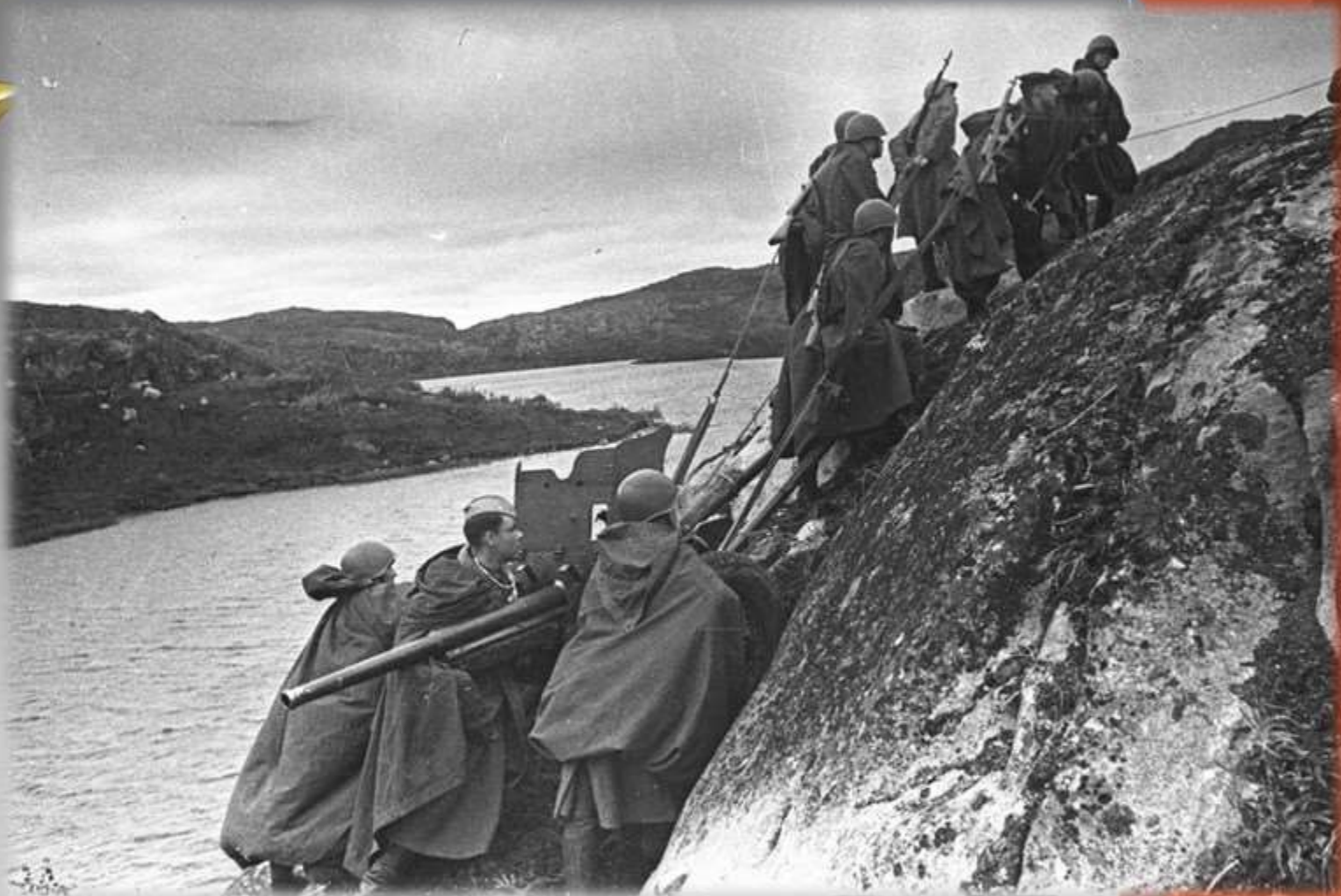
Солдаты перетаскивают артиллерийскую установку