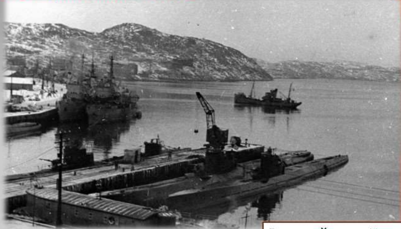
Военный порт Мурманска

Битва за Мурманск стала одним из важнейших этапов Великой Отечественной войны. Немецкое командование придавало особое значение захвату Мурманска – это был незамерзающий порт на севере Европы, связанный железной дорогой с Ленинградом. Мурманск имел важное военно-стратегическое значение. Рядом находились основные базы военно-морского флота, а также здесь начинался Северный морской путь.