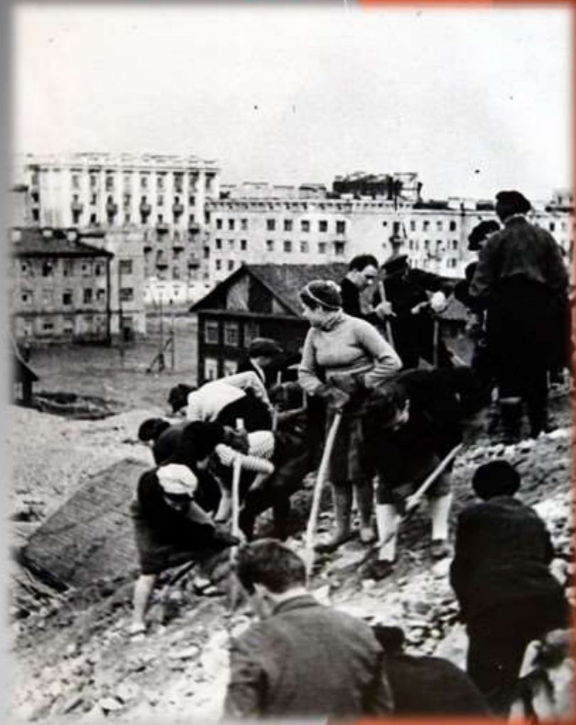
Строительство оборонительных сооружений На окраине Мурманска. 1941г.

К концу Великой Отечественной войны город был разрушен практически полностью. Сохранились только портовые сооружения и три здания в городе. Всего за время войны Мурманский порт принял 250 судов, обработал 2 миллиона тонн различных грузов. Отремонтировали 645 боевых кораблей и 544 судна, переоборудовали 55 гражданских судов в тральщики и вспомогательные корабли. За три года рыбакам удалось выловить 850 тысяч тонн рыбы, которой снабжали весь фронт.