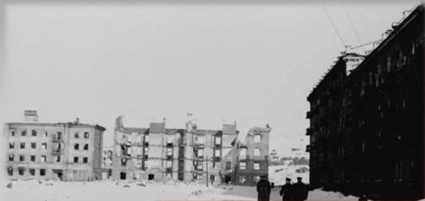
Разрушенный но не покоренный Мурманск

Самым знаменитым памятником, посвященным событиям войны, в Мурманске является мемориал «Защитникам Советского Заполярья». Он был открыт в честь 30-летия разгрома немецко-фашистских войск и посвящен всем павшим героям. Мурманск отмечен на аллеях городов-героев во многих городах, получивших это звание, а также на аллее ветеранов Второй мировой войны в Вашингтоне.