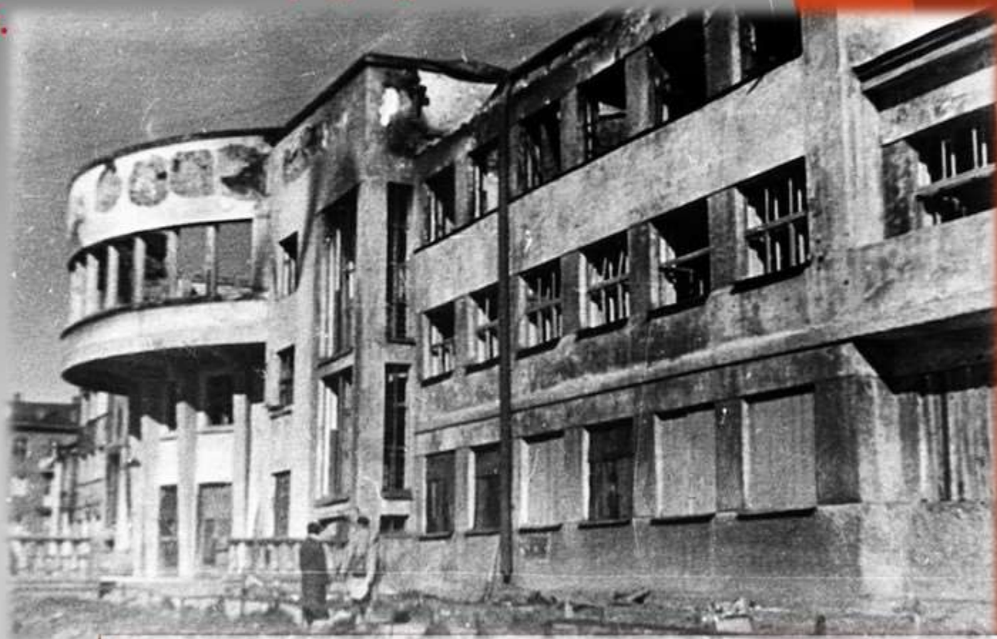
Дв. культуры им. Кирова, разрушенный в июле 1942г.

К началу Великой Отечественной войны в Мурманске насчитывалось несколько десятков каменных зданий, а население города достигло 120 тысяч жителей.