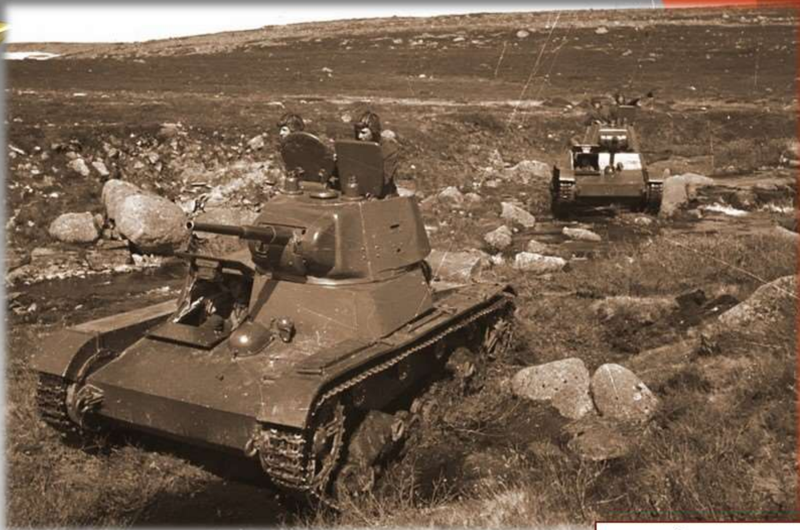
Легкий танк Т-26