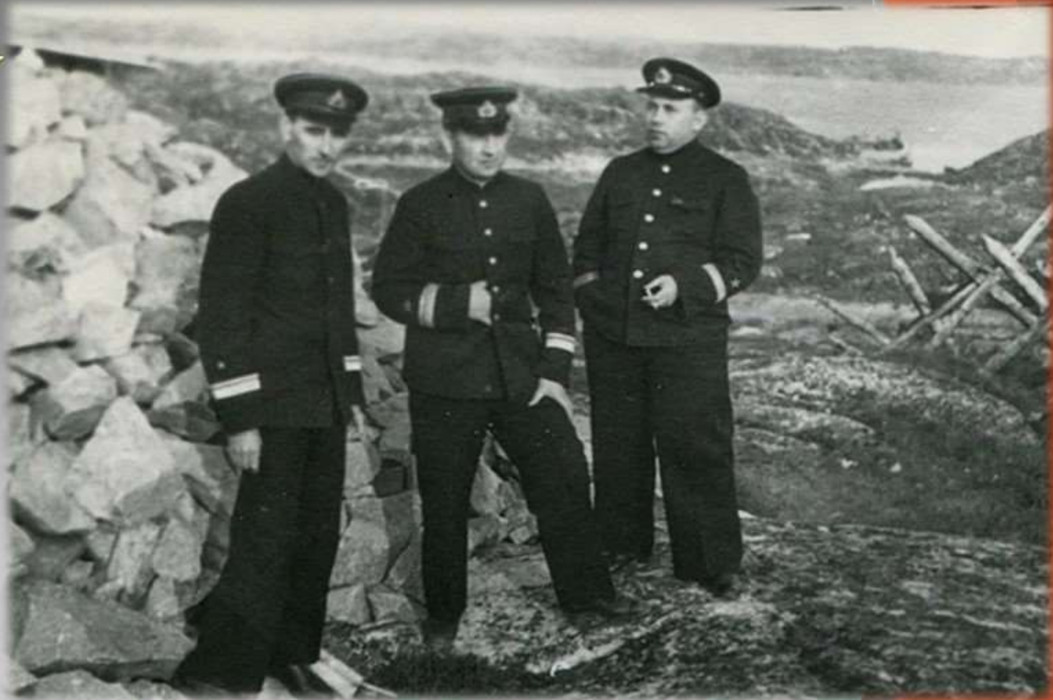
Представители Северного флота на оборонительном рубеже