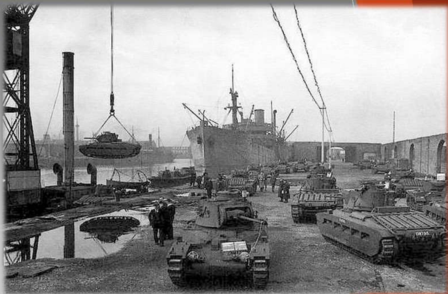
Разгрузка военной техники