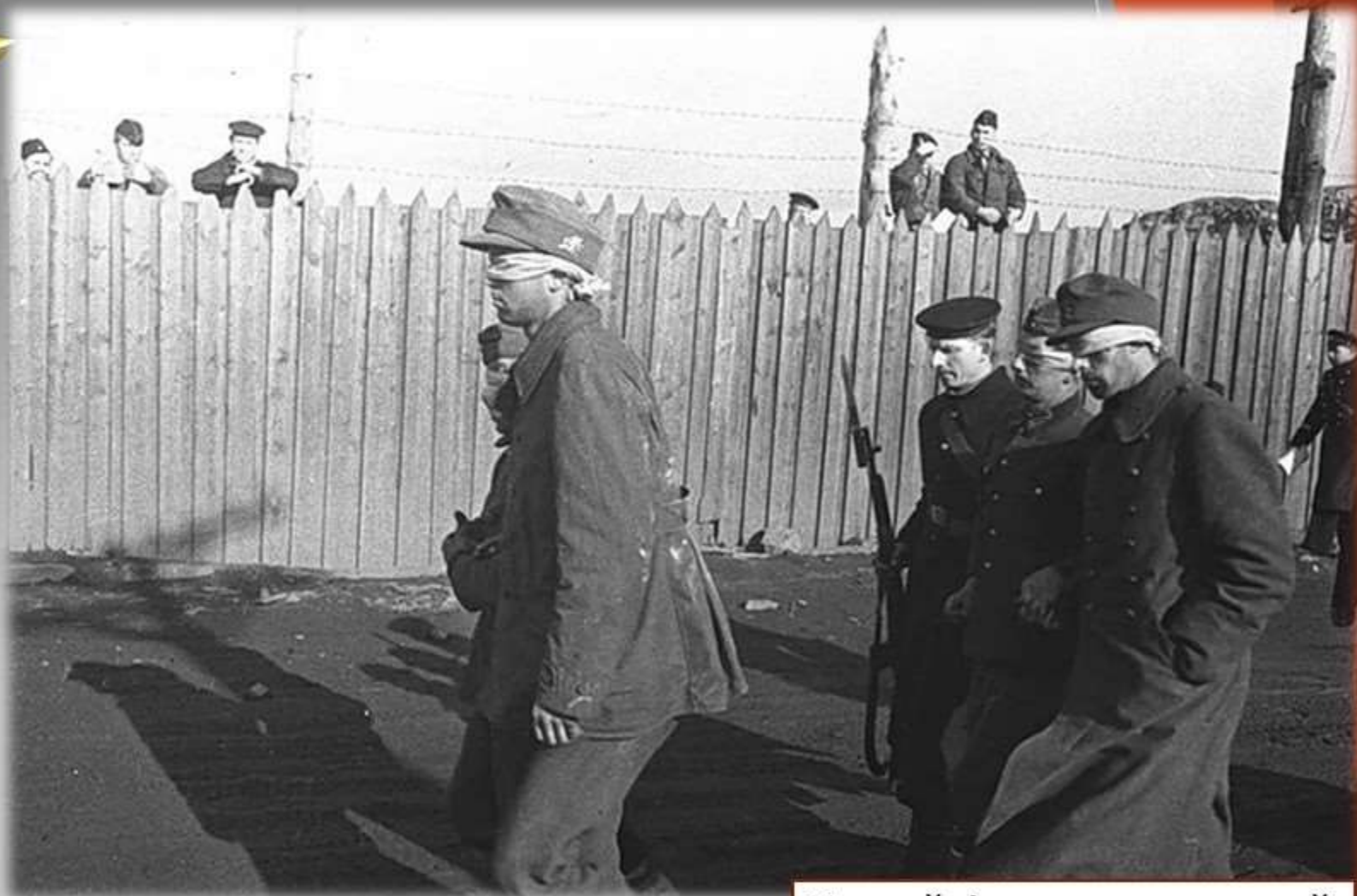
Конвой фашистских егерей