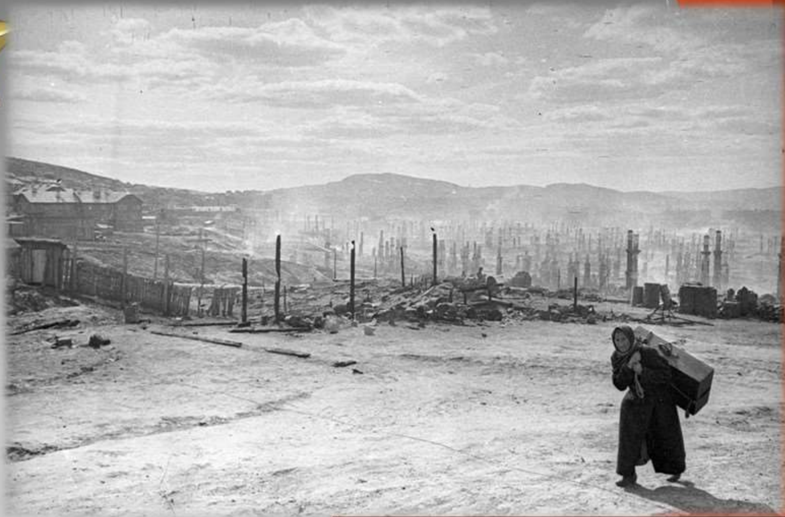
Мурманск после налета немецкой авиации