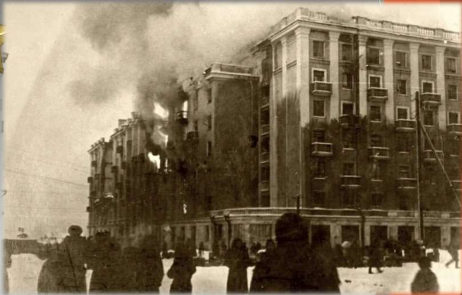
Горящий после бомбардировки дом №40 на пр. Сталина, ныне пр. Ленина, 1942г.