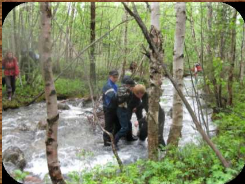
ПЕРЕПРАВА ЧЕРЕЗ РЕКУ